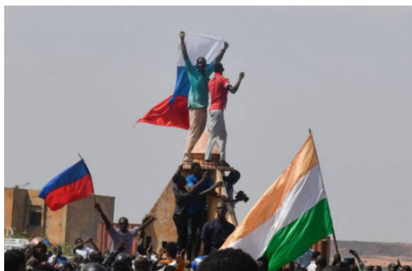
Em frente à embaixada da França em Niamei, manifestantes exibem bandeiras do Níger e da Rússia

Para quem não sabe, essa é uma região que vem sofrendo há mais de uma década com a atuação de grupos jihadistas. Tropas francesas estavam prestando apoio a esses países desde 2013, sendo que após esse golpe no Níger, elas estão em vias de ser completamente expulsas da região. Manifestações populares atacam embaixadas francesas e dirigem insultos em protesto contra os antigos colonizadores – e agora hasteiam bandeiras da Rússia.